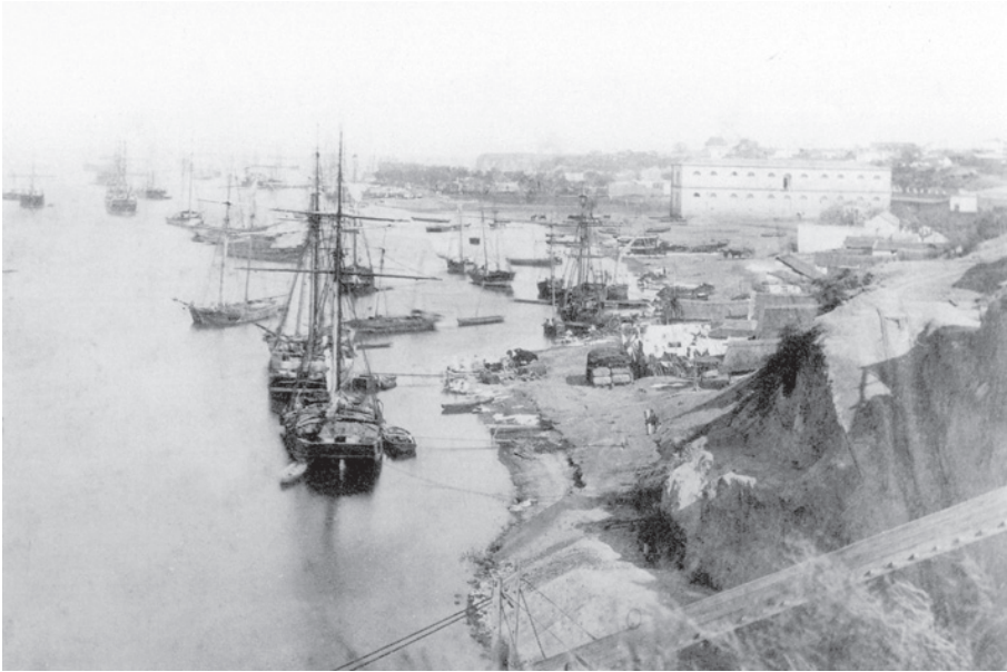
Vista del puerto, Rosario ca. 1868

provincias del norte se efectuará por este puerto. La situación favorable de Rosario, así como la inmensa extensión de su suelo fértil, accesible a sus habitantes, harán siempre de esta ciudad un centro próspero, propicio a la industria y laboriosidad de sus habitantes. Después de Montevideo, Rosario está destinado a ser el cuerpo más importante de esta parte de América... 358