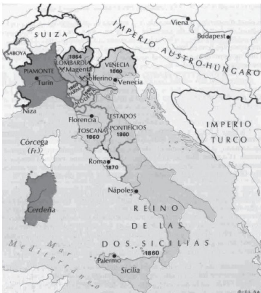
Italia en víspera de la Unificación

En esta dinámica, la Guerra de Sucesión Española no podía dejar neutral al ducado. El Ejército franco-español aspiraba a garantizarse el corredor de tránsito del ducado para conectar la región transalpina con Milano y afrontar la amenaza del Imperio Austriaco en la llanura. Se vió presionado a firmar un acuerdo con París y Madrid en