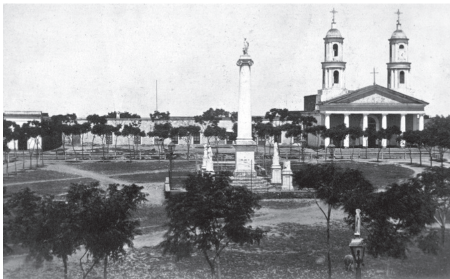
Plaza 25 de Mayo, Rosario, ca. 1868