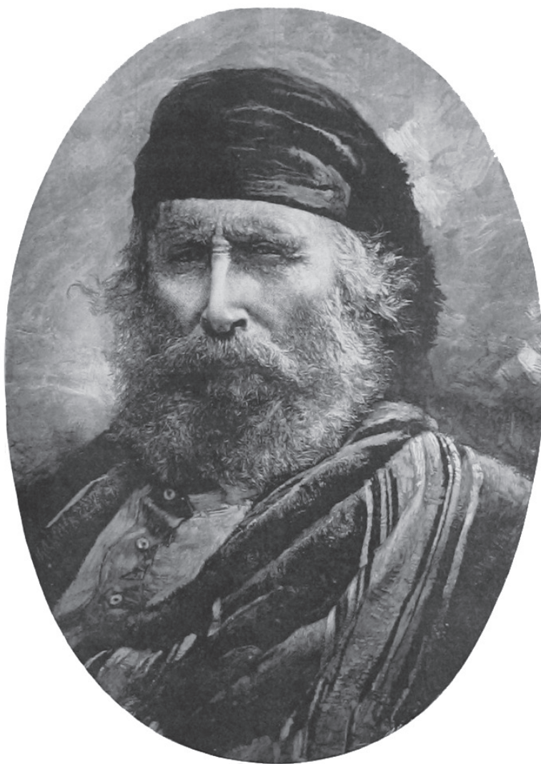
Giuseppe Garibaldi Publicado en Harper's Weekly , junio de 1882