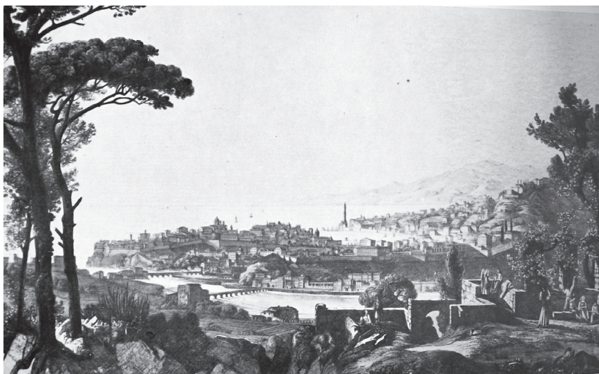
Vista de Génova a principios del siglo XIX