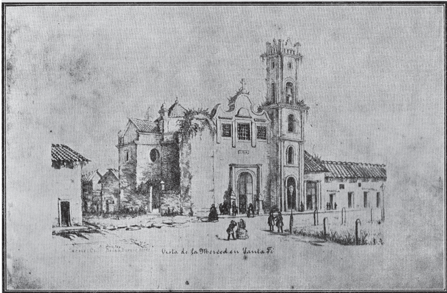
Santa Fe (Iglesia de la Merced) a principios del siglo XIX