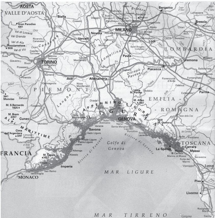
Actual provincia de Génova y sus límites

Estas y otras resoluciones mostraron que los intereses económicos de la ciudad, finalmente, estaban entrando en el corazón del programa de reforma e integración carloalbertino a la Europa decimonónica. Estas nuevas perspectivas se articularon a los intereses de cierto establishment de los negocios constituido por comerciantes, armadores, banqueros, empresarios así como a una borghesia del sapere –intelectuales, publicistas, docentes universitarios, profesionales liberales– unidos por las expectativas de la modernización y de la renovación política-institucional.