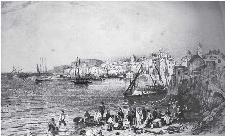
Vista del puerto de Savona en la primera mitad del siglo XIX

Como lógica consecuencia del aumento del tráfico, el flujo de información también se incrementó, generando un efecto expansivo sobre la ampliación de las cadenas migratorias por las que circulaban noticias de las posibilidades que ofrecía este espacio. Todo lo cual se articuló a las características de ese tránsito ultramarino: las naves transportaban mercancías, pero sobre todo trasladaban personas, actividad que resultaría finalmente el mejor negocio de la flota mercante genovesa.